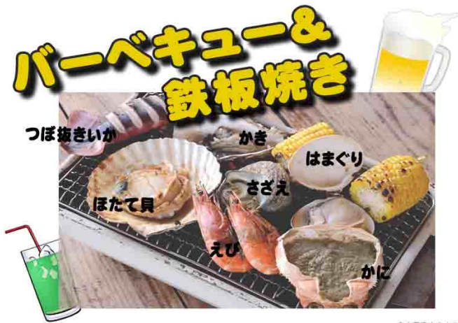
中水青森中央水産機